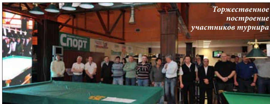
Торжественное построение участников турнира